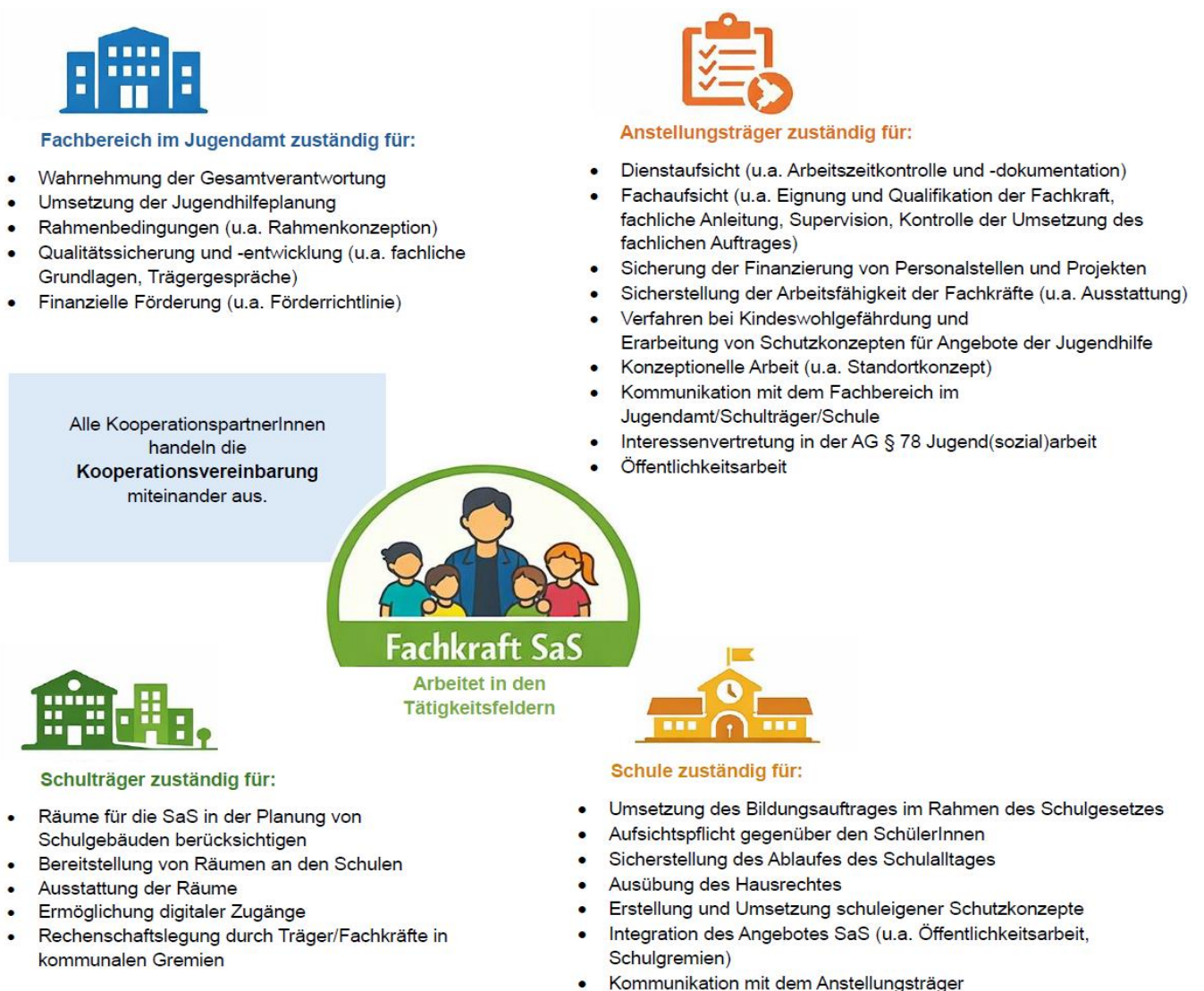
Grafik 1: Kooperation

Damit die Sozialarbeiterinnen und Sozialarbeiter an Schulen zielführend und verlässlich arbeiten können, braucht es geeignete Rahmenbedingungen und die Mitwirkung der Kreisverwaltung, der Schule, des Schulträgers und des Anstellungsträgers.